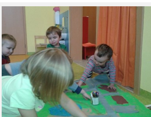
Mapa okolí školky