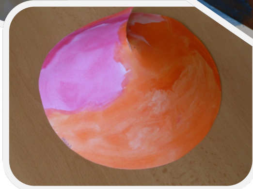
Asijský klobouk Amálka, 4 let,