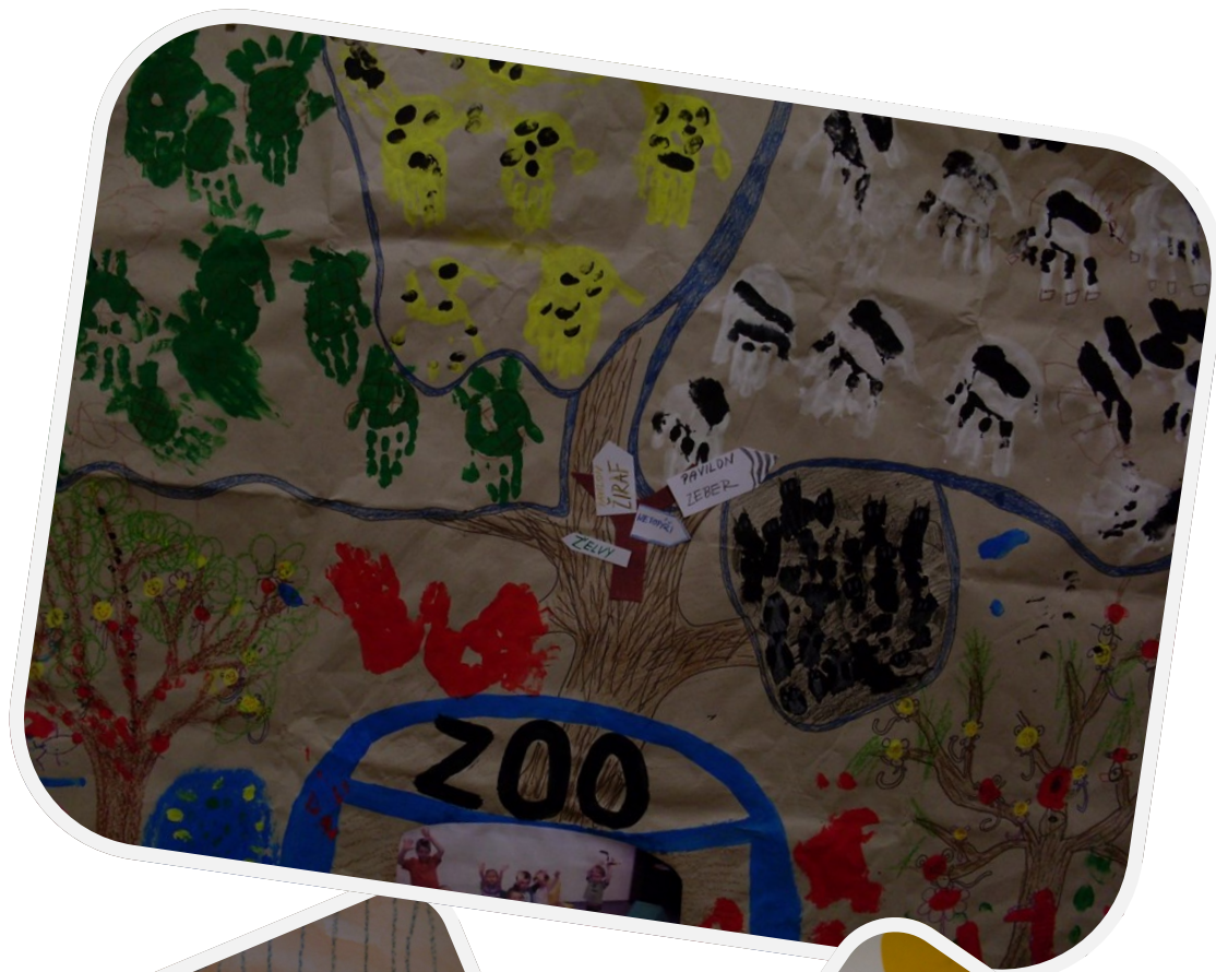
Zoologická zahrada - kolektivní práce